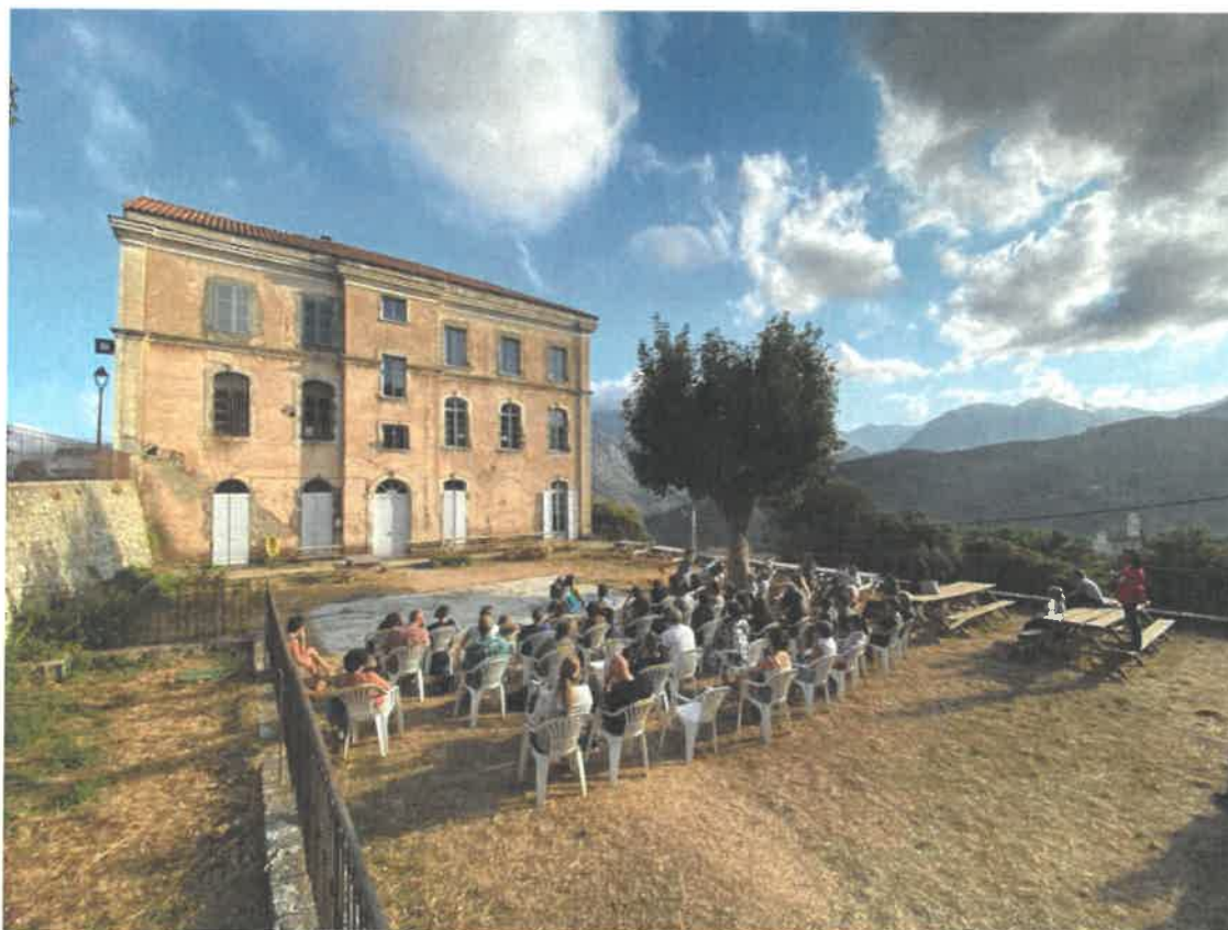
Etablissement Battaglini- spectacle Cie Creacorsica