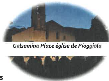
Gelsomina Place église de Pioggiola